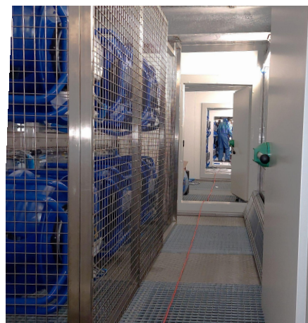
Système de ventilation pour refroidissement

Soutenu par ProKilowatt, sous la direction de l'Office fédéral de l'énergie