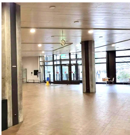
Éclairage dans un hôpital